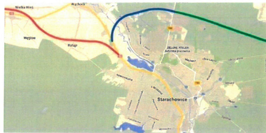
Planowana obwodnica miasta Wąchock w ciągu drogi krajowej Nr 42

Z informacji medialnych wynika iż te zadania na ten moment w żadnym sposób nie łączą się w żadnym miejscu bezpośrednio. Pośrednio łączyć ma je droga 42 a wykonanie bezpośredniego łącznika pomiędzy obwodnicami jest tylko pewną koncepcją, co do której nie ma pewności realizacji.