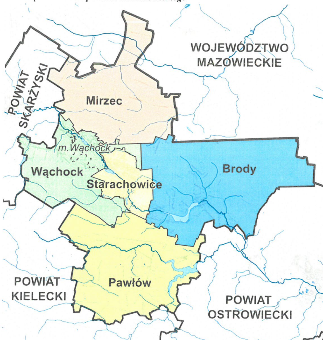
Rys. 2 – Gmina Wąchock na tle powiatu starachowickiego 2