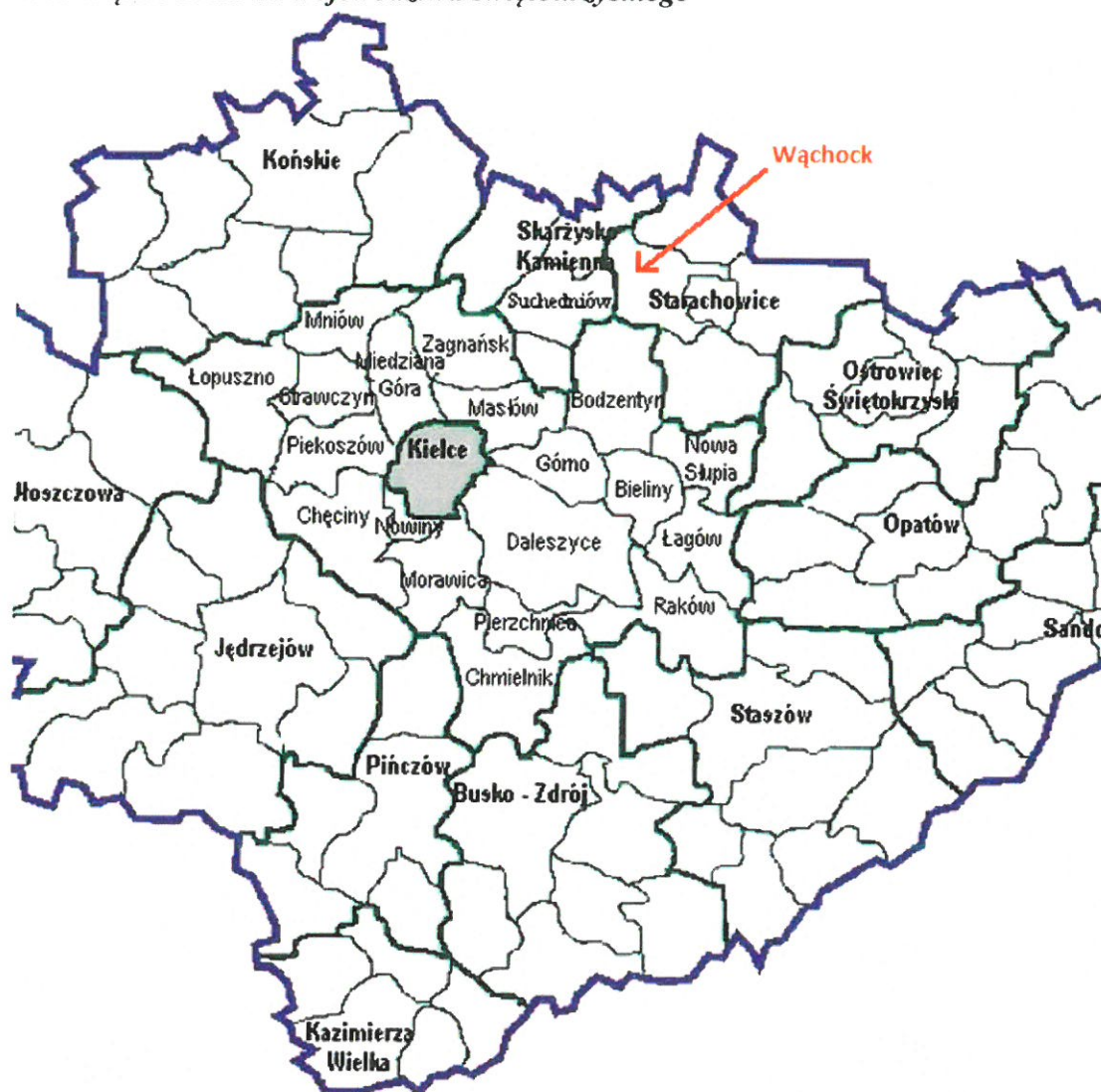
Rys. 1 – Gmina Wąchock na tle województwa świętokrzyskiego 1

Teren gminy obejmuje: miasto Wąchock, będące siedzibą władz samorządowych i pięć sołectw (tj. Rataje, Marcinków, Wielka Wieś, Parszów i Węglów), w których mieszka 6860 osób. Przez miasto przebiega linia kolejowa Łódź Kaliska - Dębica oraz droga krajowa 42 łącząca województwa opolskie, śląskie, łódzkie i świętokrzyskie. Wąchock to jedno z najstarszych miast w Polsce z Opactwem Cystersów, którego początki sięgają 1179 r.