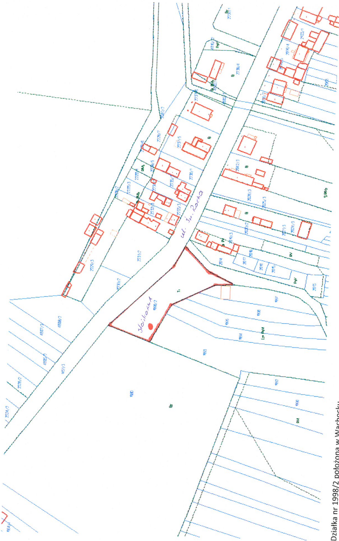
Działka nr 1998/2 położona w Wąchocku