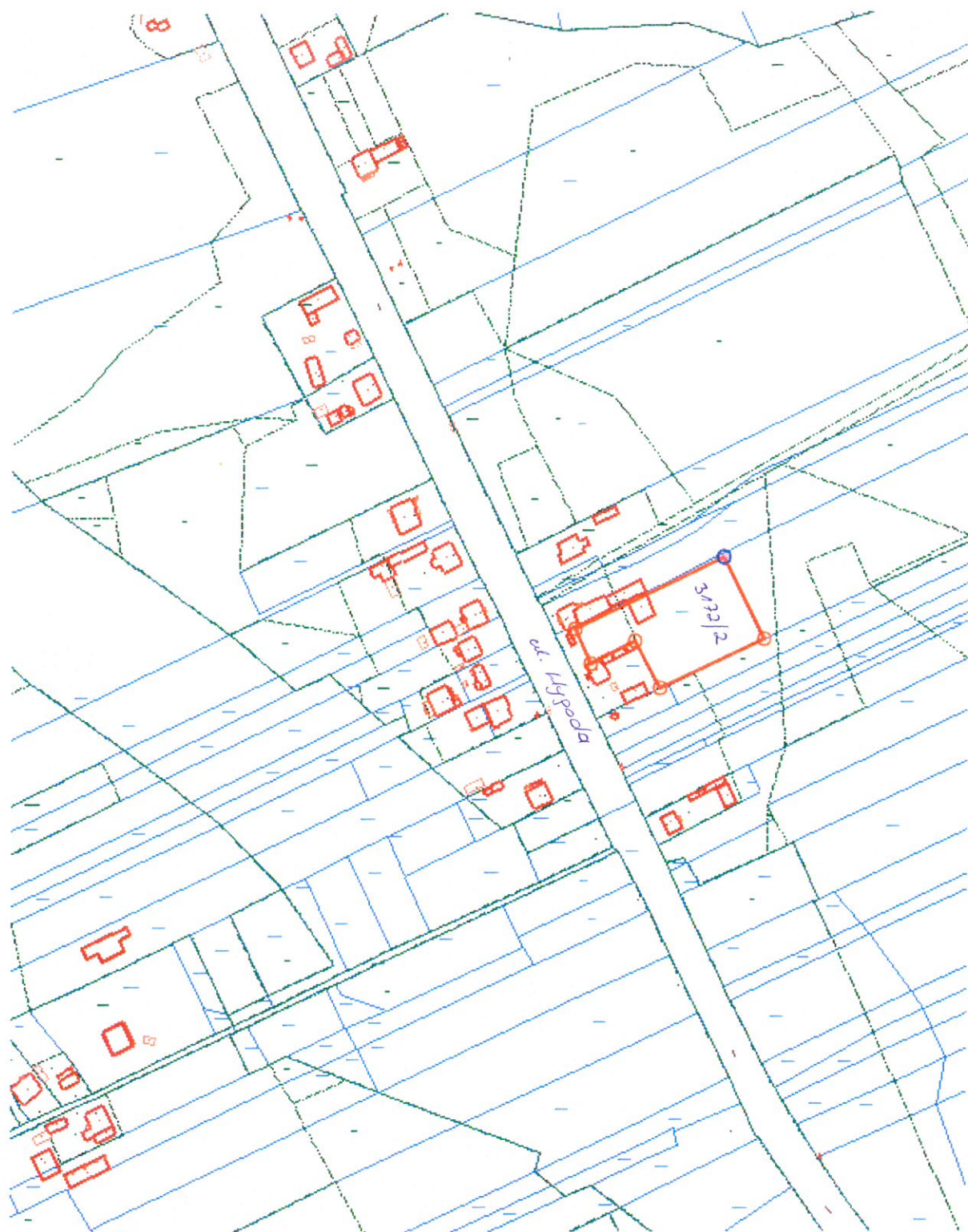
Działka nr 3172/2 położona w miejscowości Wąchock