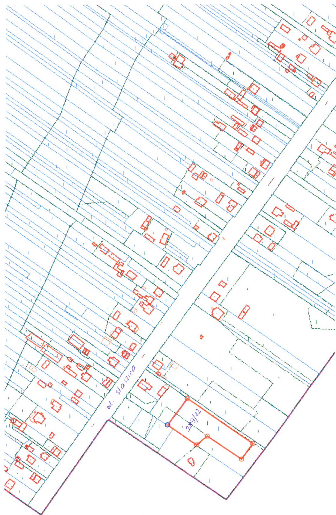
Działka nr 289/12 położona w miejscowości Parszów