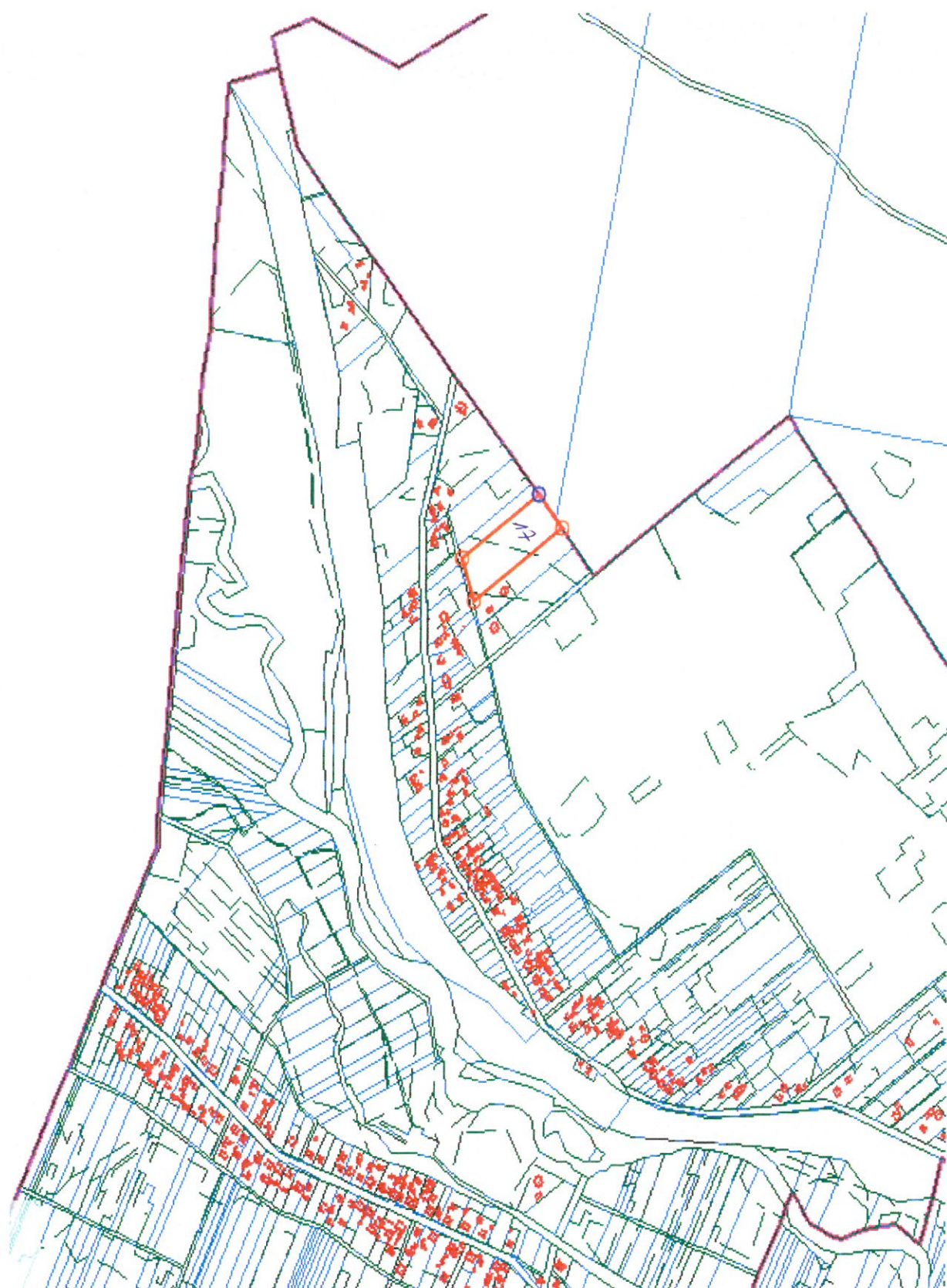
Działka nr 17 położona w miejscowości Marcinków