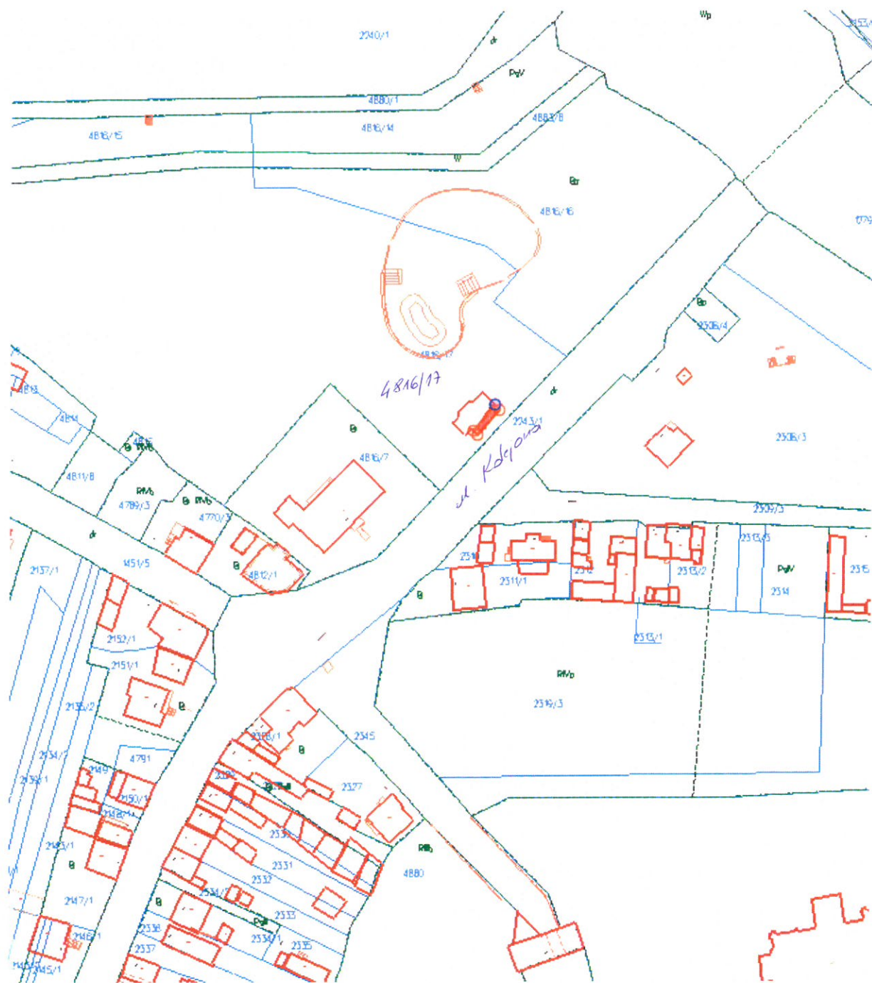
Działka nr 4816/17 cz. położona w Wąchocku