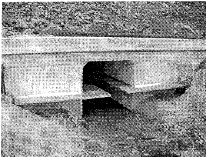
Półki z elementów stalowych